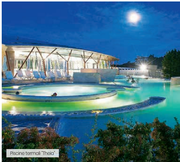
Piscine termali "Theia"

Il Grand Hotel Le Fonti è situato nel cuore di Chianciano Terme, il luogo ideale per prendersi cura del proprio benessere grazie alla presenza delle terme e scoprire i magici borghi disseminati nella campagna toscana.