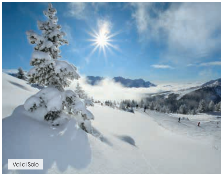
Val di Sole

L'Hotel Vecchia America è situato a Dimaro, soluzione ideale per chi desidera trascorrere le proprie vacanze in completo relax nell'area wellness dell'hotel oppure alla scoperta della natura che circonda questa struttura. ALTITUDINE: 750 metri. SKI AREA: Folgarida, Dimaro, Madonna di Campiglio. Distanza dalle piste: 200 metri.