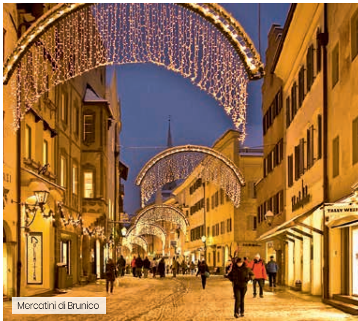
Mercatini di Brunico

L'Hotel Hellweger si trova a Campo Tures tra le montagne altoatesine delle Valli di Tures e Aurina. Arredato in tipico stile tirolese, dispone di centro benessere con sauna, idromassaggio, bagno turco e piscina. ALTITUDINE: 871 metri. SKI AREA: Speikboden. Distanza dagli impianti: circa 3 km.