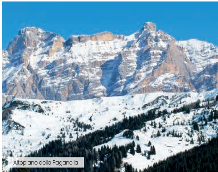
Altopiano della Paganella

L'Hotel Andalo si trova in una posizione privilegiata nell'Altopiano della Paganella: a pochi passi dal centro di Andalo e alla cabinovia del comprensorio sciistico Paganella Ski. La sua posizione, l'accoglienza e i servizi di animazione proposti, fanno dell'Hotel un posto ideale per le famiglie. ALTITUDINE: 1037 metri. SKI AREA: Andalo - Paganella. Distanza dagli impianti: 170 metri.