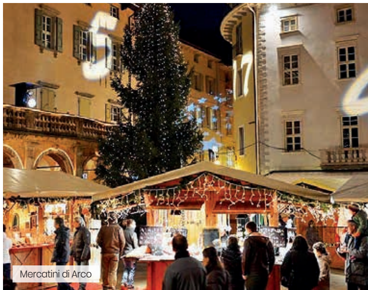
Mercatini di Arco

L'Hotel Martinelli, situato a Ronzo Chienis, una delle più suggestive località delle Val di Gresta, è il luogo ideale per chi desidera trascorrere una vacanza attiva in una posizione strategica ai piedi delle Dolomiti e a pochi chilometri dal Lago di Garda. ALTITUDINE: 1000 metri. SKI AREA: Brentonico Ski. Distanza dagli impianti: 30 km.